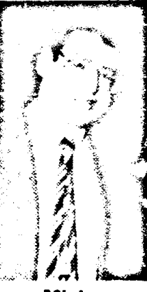
• Minister Van Thijn.

De invoering van een vrije dag kost het bedrijfsleven 500 miljoen gulden en de overheid via verminderde belastingopbrengst zo'n 200 miljoen plus een verslechterde concurrentiepositie t.o.v. het buitenland. Be-grijpt minister Van Thijn niet dat dergelijke extra-tarjes nu niet meer kunnen. Laten we er de komende jaren gezamenlijk naar streven om ons land uit het slop