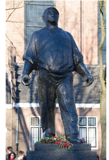
De Dokwerker

De eerste razzia's in Amsterdam vonden plaats op het Jonas Daniël Meijerplein op 22 februari 1941. Deze leidden tot het grootste burgerverzet tegen de nazi's en de Jodenvervolging: de Februaristaking. Duizenden Amsterdammers legden hun werk neer, uit protest tegen het oppakken van hun joodse collega's. Het monument de Dokwerker (1952, Mari Andriessen) is gemaakt ter nagedachtenis aan deze staking.