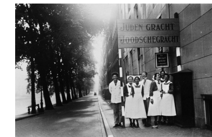
De Nieuwe Keizersgracht, ca. 1941 Collectie Joods Historisch Museum, Amsterdam

Het monument aan de Nieuwe Keizersgracht, ook wel Schaduwkade, herinnert aan meer dan 200 weggevoerde joodse Amsterdammers. Hun namen zijn op 200 naam bordjes vereeuwigd in de kade tegenover het huis dat zij bewoonden. Ieder jaar op 4 mei worden zij door de huidige bewoners herdacht.