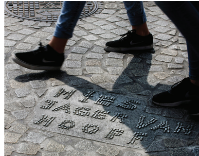
Het monument op de Dam voor de slachtoffers van de schietpartij op 7 mei 1945

5 mei 1945 ging de boeken in als officiële bevrijdingsdag van ons land. De onrust was echter nog niet geweken in de eerste dagen na de bevrijding. Op 7 mei 1945 onttaarde dit in een schietpartij op de Dam tussen nog aanwezige Duitse eenheden en de Binnenlandse Strijdkrachten. Ruim 30 mensen kwamen daarbij om het leven. In 2016 werd er een monument onthuld aan de noordzijde van de Dam dat deze slachtoffers herdenkt.