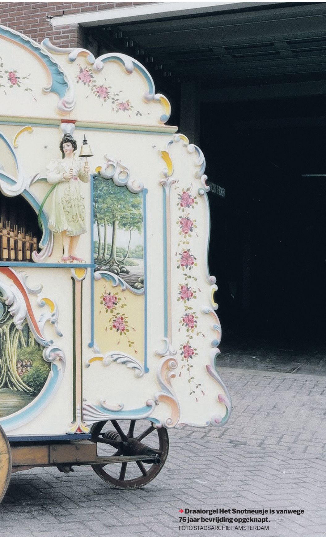
→ Draaiorgel Het Snotneusje is vanwege 75 jaar bevrijding opgeknapt.

tegenaan gereden, waardoor een wiel was afgebroken. Omdat er na de bevrijding grote behoefte was aan vermaak, werd het snel opgelapt door de firma Perlee en ging het de straat weer op.